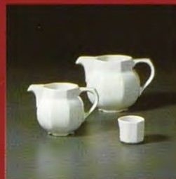
GIESSER / creamer / crémier / latteria / lechera