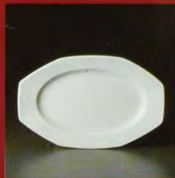
PLATTE OVAL / platter ov. / plat ov. /