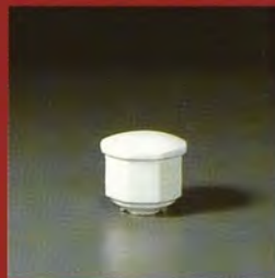
ZUCKERDOSE MIT DECKEL / sugar / sucrier