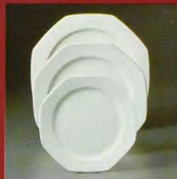
TELLER / plate / assiette / piatto / plato