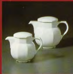
KANNE / coffeepot / cafetière /