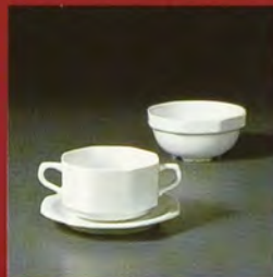
SUPPENOBERTASSE / soupbowl / bol bouillon /