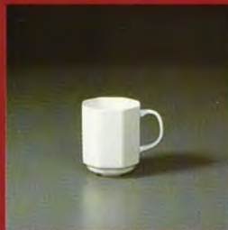
BECHER / mug / chope / bicchiere / vaso