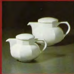
TEEKANNE / teapot / théière / teiera / tetera